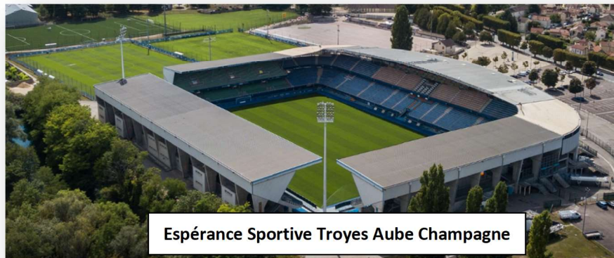
Espérance Sportive Troyes Aube Champagne

Troyes et le football, c'est une longue histoire..., puisque le premier club troyen fut créé en 1900. Il s'agissait de l' Union Sportive Troyenne . Celle-ci fusionne en 1930 avec l'Association Sportive de Sainte-Savine, club de l'agglomération troyenne, pour donner naissance à l' Association Sportive Troyenne et Savinienne , l'ASTS. En 1935, l'ASTS adhère au professionnalisme, elle y évoluera jusque en 1963 avec des fortunes diverses : trois saisons en D1, une finale de coupe de France, deux finales de coupe Gambardella (une victoire en 1956 et une défaite en 1957)